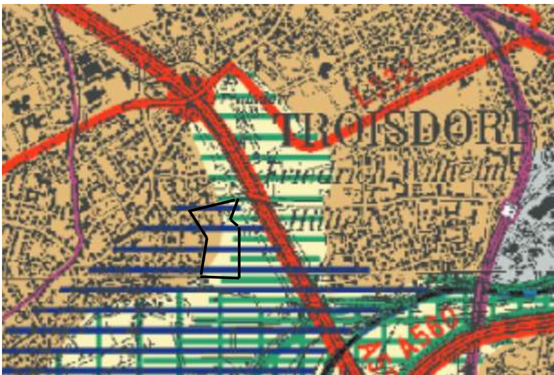
Ausschnitt Regionalplan und Einzeichnung B-Plan S 195 (vereinfacht)

Der Regionalplan sieht an dieser Stelle einen regionalen Grünzug, den Schutz des Grundwassers und den Schutz des Agrarraumes vor! Eine Abweichung von diesen Zielen im Zuge einer Abweichungsentscheidung steht der Regionalplanungsbehörde nicht zu, da mit ihr im konkreten Fall die verfolgten Grundzüge der Regionalplanung in Frage gestellt werden. Dass der bestehende FNP bereits teilweise von den Vorgaben des Regionalplanes abweicht, entspannt die Situation nicht.