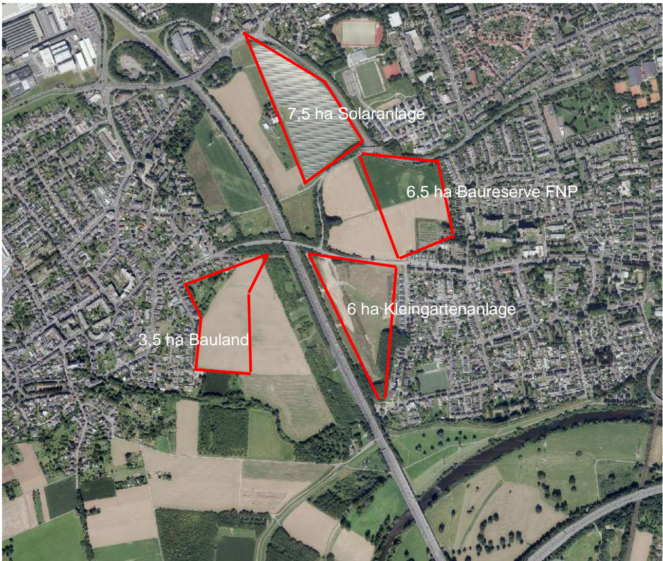
1: Das Luftbild zeigt die hohe Bedeutung der Fläche des S 195 als Naturraum im Anschluss an die bestehende Aue des FFH-Gebietes (Sieg)

Wir regen an, wegen der hohen naturschutzfachlichen Bedeutung der Fläche für die zukünftige weitere Entwicklung des Siegkorridors als wirksame, landesweit bedeutsame Biotopverbundachse die Bebauungsabsichten an dieser Stelle vollständig aufzugeben und auch den FNP entsprechend den Zielen des Regionalplanes zu Gunsten des Freiraumschutzes zu ändern.