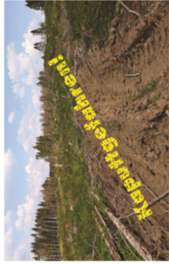
Merke: Weniger Rückegassen – gesünder Wald

Ziel muss es sein, die Wälder geschlossen zu halten. Je weniger Rückegassen den Wald gliedern, desto besser ist dies für das Mikroklima. Die Verdunstungsrate der Waldböden wird reduziert (Windruhe und Reduzierung der Sonneneinstrahlung) und die Wasserversorgung wird verbessert. Insgesamt werden die Bäume und die gesamte Waldlebensgemeinschaft weniger gestresst. Wir empfehlen daher, insbesondere auf den vorgeschädigten Waldflächen entweder auf Rückegassen ganz zu verzichten (schmale Parzellen) oder bei größeren Parzellen Rückegassenabstände von ca. 60-80 Metern wählen. Die eingeschlagenen Bäume sollten dann mit Seilwinden oder (wenn möglich) mit Rückeperden an die Waldwege vor- geliefert werden.