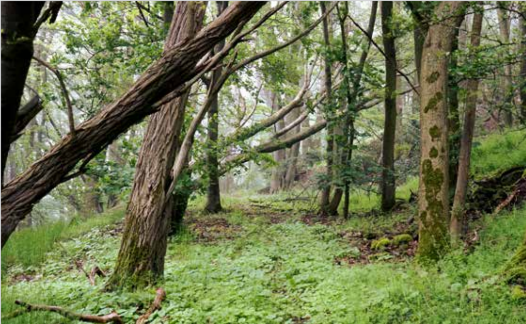
Forstlich seit Jahrzehnten unbeeinflusster Laubwald auf der Wolkenburg, Siebengebirge.

Heinrich Cotta (1817): „Anweisungen zum Waldbau“