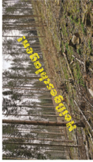
Merke: Wälder nicht heißschlagen und tote Fichten stehen lassen!

Bereits abgestorbene Nadelbäume sollten als Schirm auf der Fläche stehen bleiben. Unter dem Halbschatten dieser „Baumleichen“ entwickelt sich die nachfolgende Baumgeneration meist viel besser als auf einer Kahlfäche.